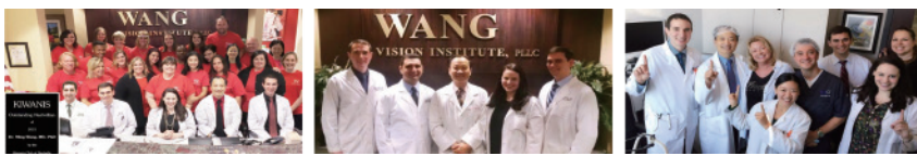
2017年1月，爱尔眼科收购美国Wang Vision眼科