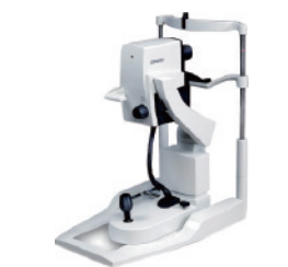
德国海德堡多模式成像平台 (OCT+Multicolor)