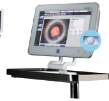
蔡司 CALLISTO eye 虹膜导航系统