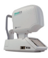
意大利MAIA微视野 检测仪