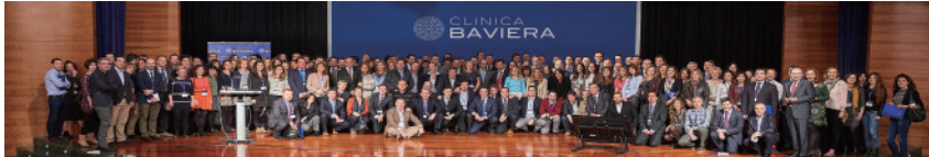
2017年8月，爱尔眼科完成对欧洲著名连锁眼科医疗上市机构CLINICA BA